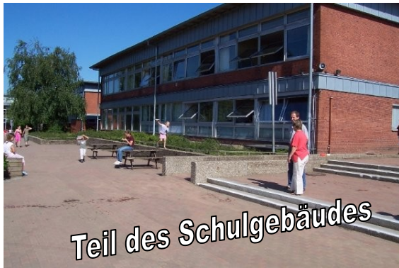
Teil des Schulgebäudes