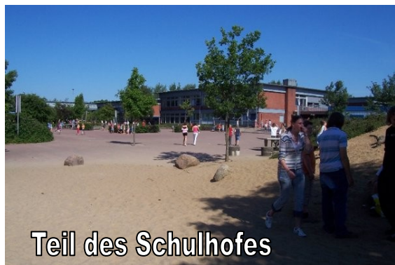
Teil des Schulhofes